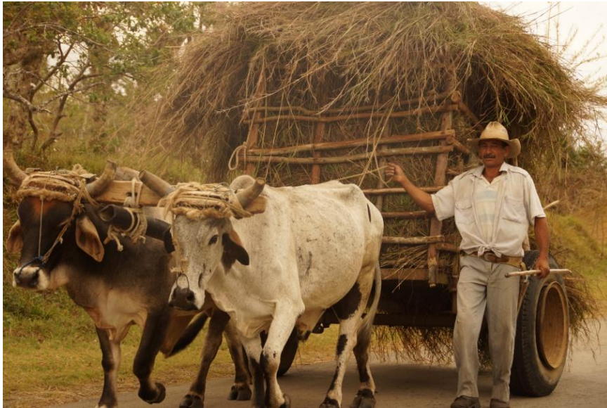
Oksespand med hølæs.

Vi så et skilt, hvorpå der stod: "For fædrelandet eller døden vil vi sejre". I Manicaragua så vi mange små gartnerier med mange forskellige afgrøder.