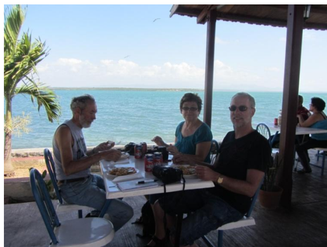
Frokost med udsigt ved Cienfuegos.

Så kørte vi tilbage mod Trinidad og gjorde holdt ved Rio Hondo, hvor der ved en strand af gammelt koralrev var nogle gode vue med sprøjt fra de indkomne store bølger. Der lå en lille militær udkigspost, men de tog ikke notits af os. Vi fortsatte øst på til sukkerdalen Valle de Los Ingenios. Dalen var Cubas største produktionssted for sukker i 1700 og 1800 tallet. Der arbejdede op til 12.000 slaver på de 40 sukkermøller med at producere sukker. Midt i området er der et 45 meter højt tårn, herfra kunne man holde øje med arbejderne og slå alarm på den store klokke, hvis nogen forsøgte at stikke af. På vej tilbage til bilen lod vi os overtale til at købe et par håndbroderede hvide duge, 5 CUC pr. stk., og oven i handelen fik vi et kæmpe smil og knus af damen, som havde lavet dem. Kjesten fik afsat en stor del af de medbragte kuglepenne. Den første til en lille pige, hun havde fotograferet. De næste til en dreng og hans mor, og de sidste til en hob af kvinder, der dukkede op for at fortælle, at de også havde børn derhjemme. Beriget på flere måder kørte vi hjem til vores lille private Casa Sara Vi var hjemme ved sekstiden.