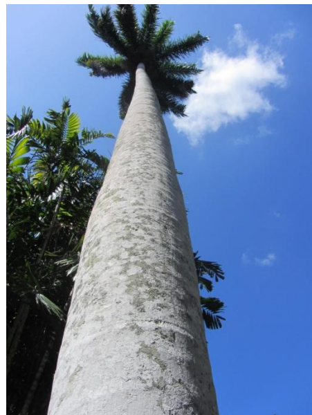
Kongepalme, Cubas nationaltræ.

Bent: Morgenmaden var en tro kopi af gårsdagens morgenmad, dog var der friskpresset guayaba. I går havde vi fået at vide at mange restauranter holder lukket om søndagen, så vi blev anbefalet at bestille mad i "vores lille hjem". Som sagt så gjort, vi blev tilbudt forskellige muligheder og besluttede os for languster. Vi startede dagens udflugt i retning mod Cienfuegos. Første mål var den botaniske have (Jardin Botanico). Vi kørte den første tid langs kysten, og kom forbi nogle meget store bassiner, hvor der indvindes salt fra havvandet. Vi var fremme ved haven kl. 10:00, og betalte 10 CUC i entre. Bilen kunne parkeres gratis, meget usædvanligt i dette land. Først gik vi ind i et overdækket hus, og så et væksthus bl.a. med kaktus, orkideer og mange arter, som vi har i stuevinduerne, bare meget større. På vej ud blev vi heldigvis "overfaldet" af en guide, han tilbød at følge os rundt i haven og vise og fortælle alt om træerne til os for 10 CUC pr. time. Han talte et fint engelsk, og tilbød blandt andet at vise os kokain træet. Så vi takkede pænt ja. Vi så Hibiscus træer med meget store blomster. Vi så også et manahu træ, hvis saft er antiseptisk. Che Guevara led af astma, han blev hjulpet ved at drikke te, som var lavet af blade fra dette træ. Guiden fik øje på et par tårnfalke (Cuban Cucu). Han var dybt betaget, da han så de