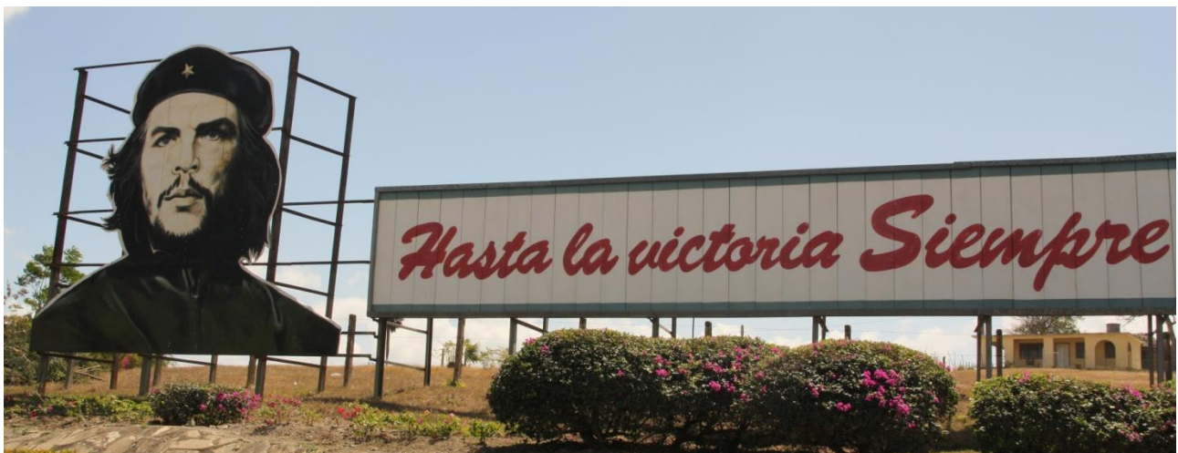
Reklameplakat med el commandante (Che Guevara)

På turen gennem Cuba har vi observeret mange "reklame-plakater". Disse meget store plakater langs vejene er blot ikke kommercielle plakater. De bringer forskellige revolutionære udsagn eller citater som f.eks. "Vas bien Fidel" (går det godt Fidel). Denne sætning/dette spørgsmål sluttede Che Guevara altid sine breve til Fidel Castro i sin tid i Bolivia. Andre udsagn kunne være "vore helte vender tilbage"